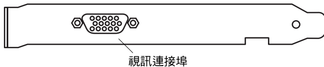
圖 1-2 Sun PGX64 背板