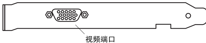
图 1-2 Sun PGX64 底板

图 1-2 显示了 Sun PGX64 图形卡的底板和 HD15 显示器连接头。