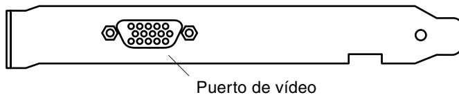
FIGURA 1-2 Placa trasera de la tarjeta PGX64

En la FIGURA 1-2 se muestra la placa trasera de la tarjeta gráfica Sun PGX64 y el conector del monitor HD15.