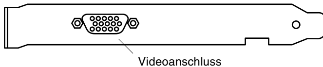
ABBILDUNG 1-2 Rückseite der Sun PGX64-Grafikkarte

ABBILDUNG 1-2 zeigt die Rückseite der Sun PGX64-Grafikkarte und den HD15-Bildschirmanschluss.